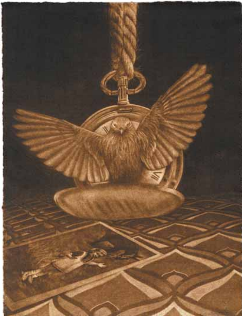
MEMENTO... TEMPUS FUGIT, 2016 (Mezzotinta 28x20)