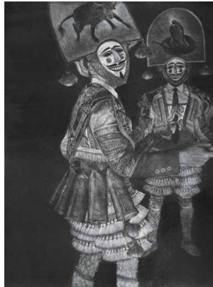
ENTROIDO, 2017 (mezzotinta 27.5 x 20.5)