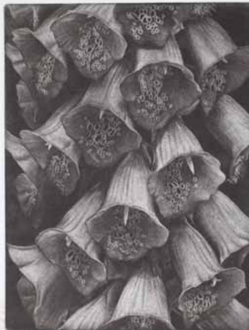
DIGITALIS CORDIS, 2015 (mezzotinta 33 x 28)